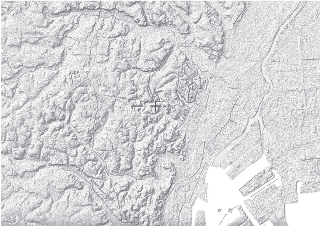
【地図Ⅰ】 いんえいきふくす 陰影起伏図※

※北西の方向から地表面に向かって光を当て、凹凸のある地表面の北西側が白く、南東側が黒くなるよう作成した図。(地理院地図)